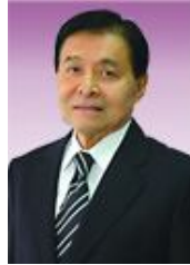
นายชโล piegel อารมย์